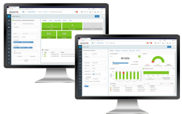
Asset Details und SLA Details in Web-Dashboards

IT-Services können individuell in SLA's eingebunden werden. Die effektive Verfügbarkeit des Service wird kontinuierlich der definierten Compliance gegenübergestellt. Der aktuelle Erfüllungsgrad wird fortlaufend berechnet. Web-Dashboards oder Push Notifikation auf dem Smartphone informieren Service-Verantwortliche frühzeitig über mögliche SLA-Breaches.