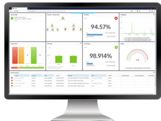
Service Board des UC Service Voice

Ceeview bietet Verantwortlichen die Möglichkeit, komplexe Unified Communication Services aus der Infrastruktur- und End-User Perspektive zu überwachen. Der aktuelle Service Zustand ist jederzeit einsehbar und potentielle Probleme werden frühzeitig erkannt. Dies ermöglicht den optimalen Betrieb geschäftsrelevanter Services.