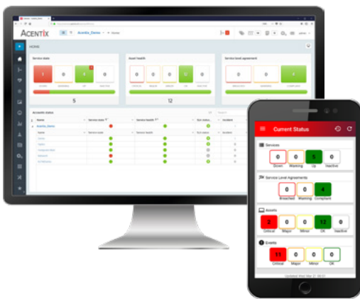
Service State Ansicht im Browser und in der Mobile-App

Ob Weboberfläche oder Mobile APP – mit Ceeview erhalten Sie jederzeit und überall eine komplette Übersicht zum Zustand, respektive zur Verfügbarkeit Ihrer Services und Ihrer Infrastruktur.